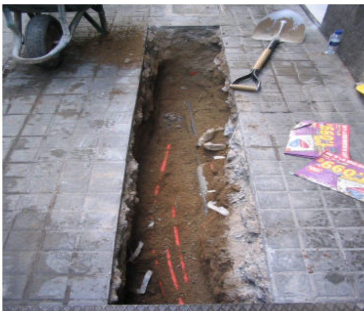
Fotografia núm. 2: Rasa 100, un cop obert el segon tram.