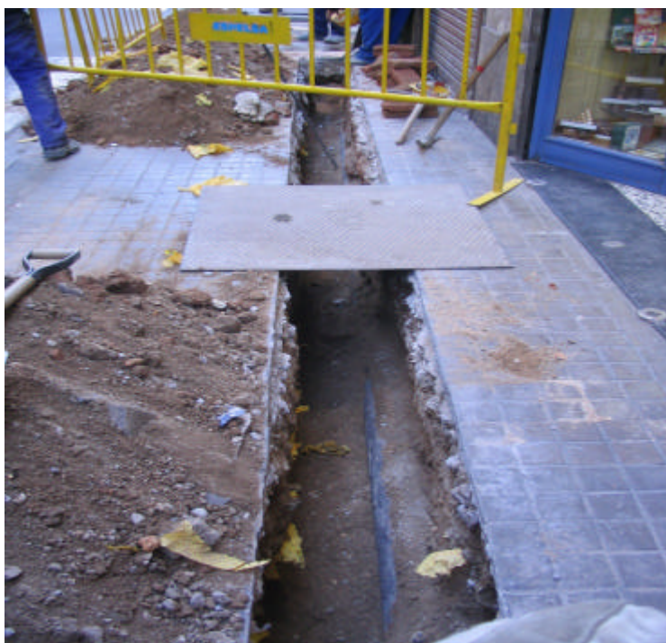
Fotografia núm. 1: Rasa 100 un cop oberta el primer tram.