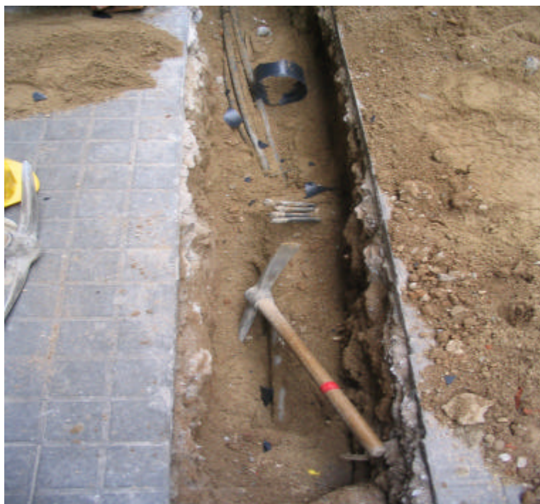
Fotografia núm. 4: Rasa 100, un cop obert el quart tram.