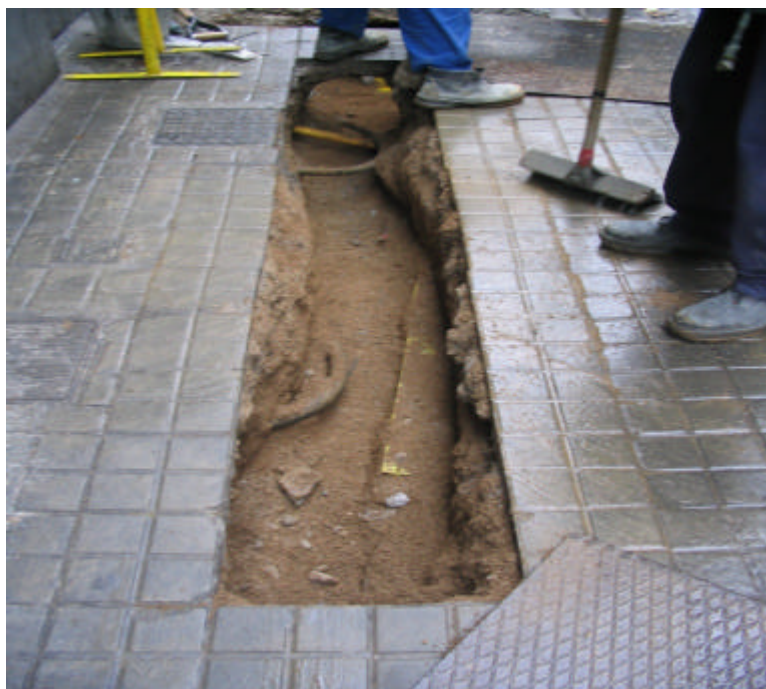
Fotografia núm. 6: Rasa 100, un cop obert el sisè tram.