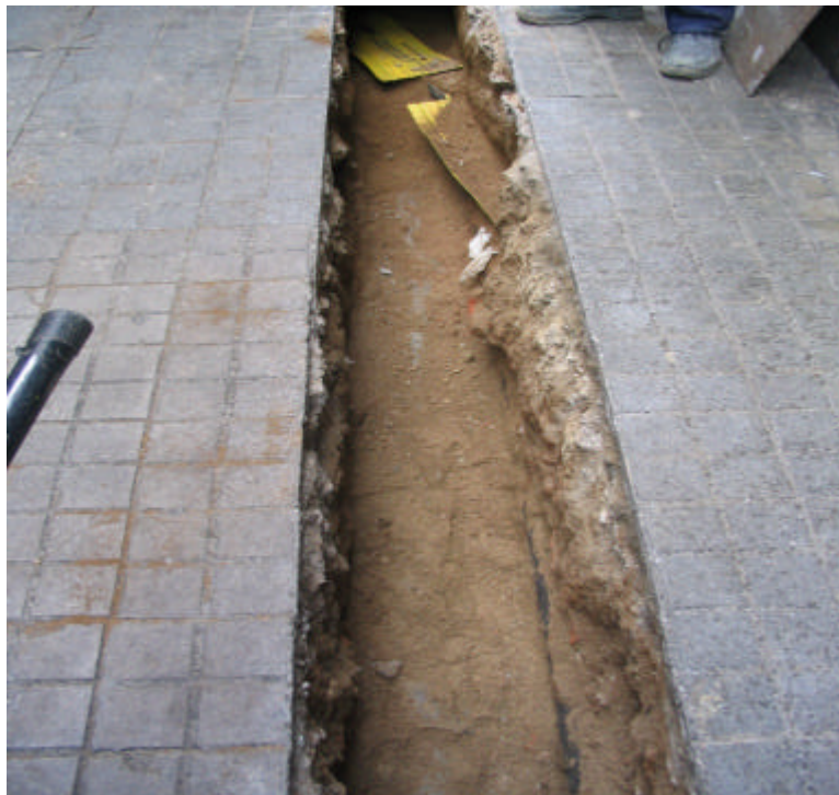
Fotografia núm. 5: Rasa 100, un cop obert el cinquè tram.