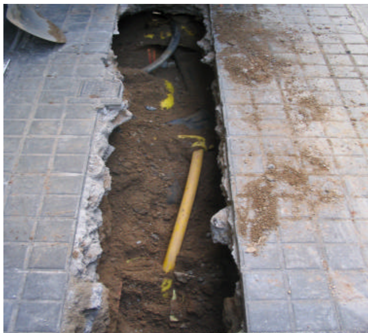
Fotografia núm. 3: Rasa 100, un cop obert el tercer tram.